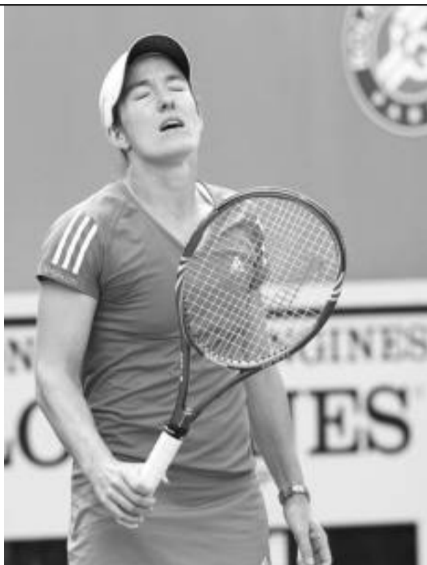
Justine Henin s'arrête en huitièmes de finale. Rafael Nadal, lui, continue tranquillement son chemin.

Justine Henin, stoppée, hier, dès les huitièmes de finale par l'Australienne Samantha Stosur dans sa tentative de reconquête de Roland-Garros, a vérifié à ses dépens qu'on ne redevient pas reine en quelques mois.